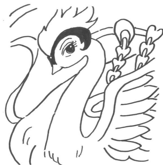
タニ - 「火の鳥」