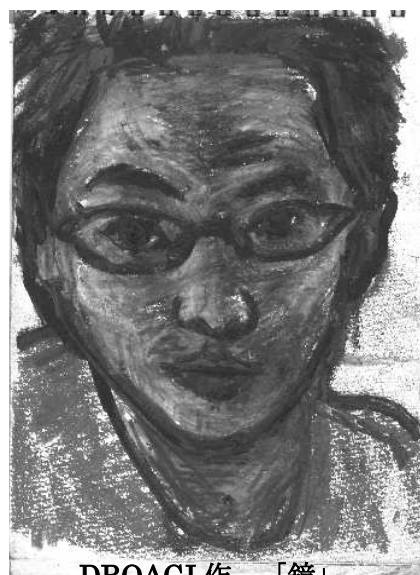
DROAGI 作 「鏡」